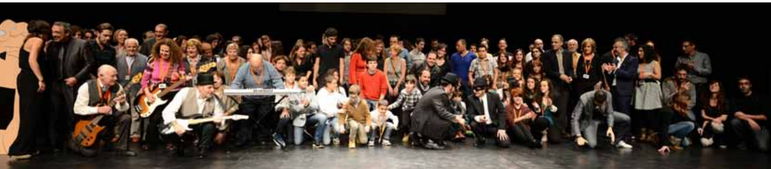
▲ Foto de familia 2014.