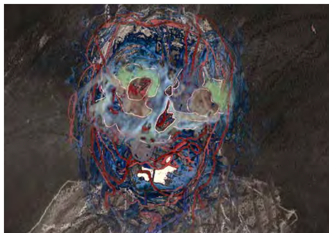
▲ You look like me