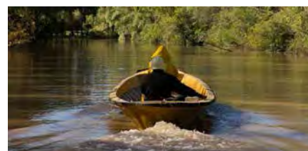
▲ El dorado de Ford