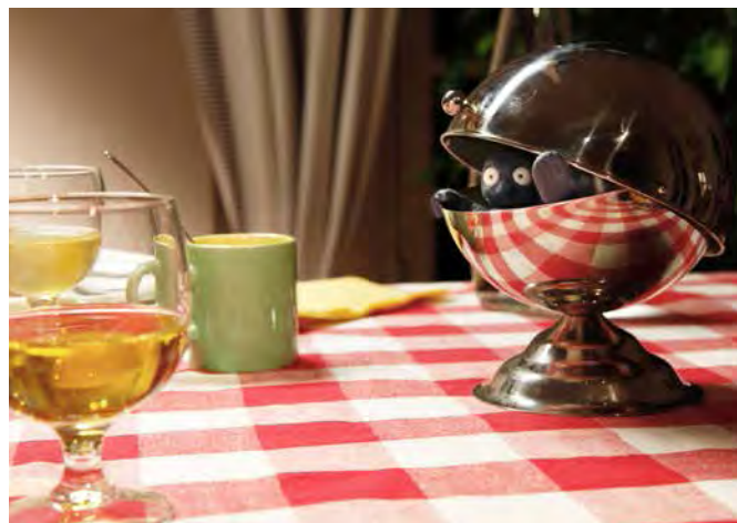
▲ Table Bob (FESTIVAL COURANT 3D)