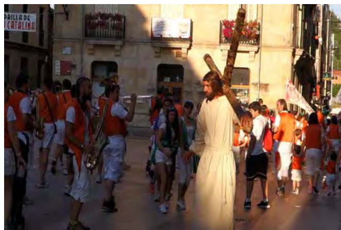
▲ Penitencia Sanjuanera