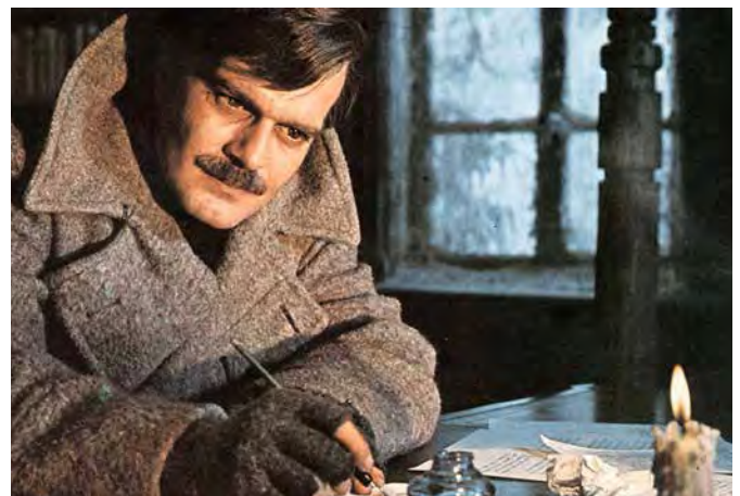
▲ Omar Shariff (DOCTOR ZHIVAGO)

La proyección de la película y la presentación del libro servirán como homenaje al actor protagonista del filme recientemente fallecido Omar Shariff.