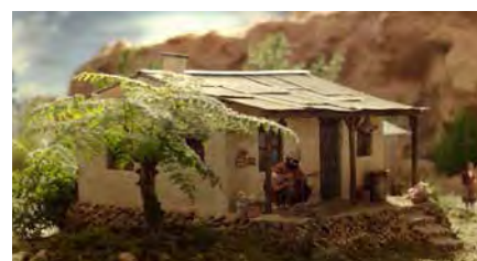
▲ Payada pa' Satán

En los dos últimos años diferentes directores argentinos han sido premiados en el Certamen, consiguiendo a posteriori el máximo galardón que otorga la academia de cine en Argentina, el Cóndor de Plata al mejor cortometraje, equiparable al Premio Goya español.