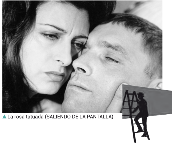
▲ La rosa tatuada (SALIENDO DE LA PANTALLA)

Fuera del microteatro se representará la obra 'El sobrino de Méliès' en el Palacio de la Audiencia. Un espectáculo para todos los públicos que mezclará la actuación con la magia y la globoflexia.