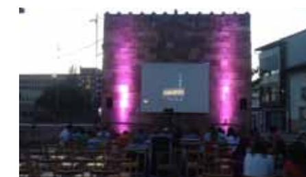
▲ Cine a los cuatro vientos.