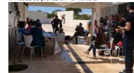
▼ Rueda de prensa en Formentera.