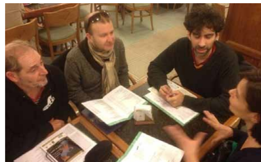
▲ El jurado reunido en la II Semana de Soria en Argentina.