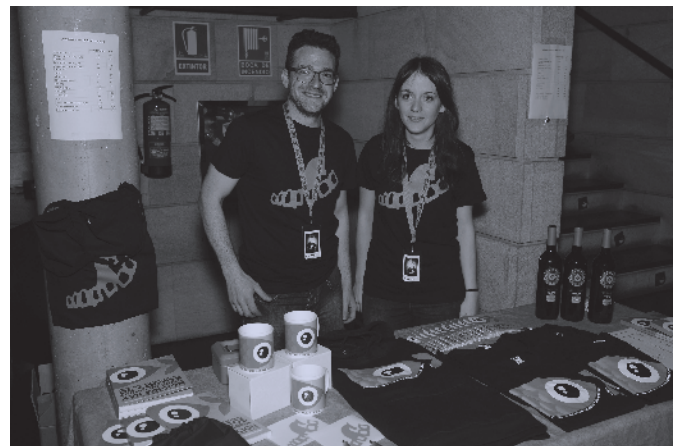
▲ Voluntarios encargados de la venta de merchandising.

A los ya veteranos siempre se suma algún novato al que acogemos con los brazos abiertos.