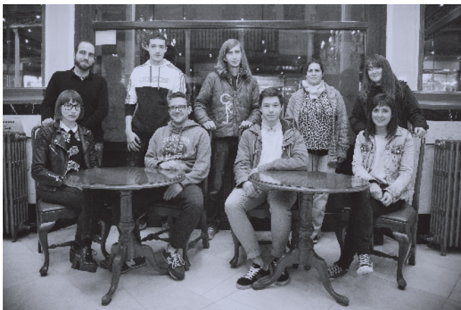
▲ No están todos los que son pero son todos los que están.

Trabajan muy duro a cambio de muy poco pero formando parte del equipo de voluntarios se suman a esta gran familia, que año tras año tiene nuevos miembros. Atender a los diferentes jurados, estar allí donde hay una proyección o sesión paralela, acudir a la prisión durante la proyección de Cortos a la Sombra, vender merchandising, acreditar a las personas, recoger a los invitados y trasladarles a los alojamientos... Eso y mucho más... y siempre con una gran sonrisa en la cara.