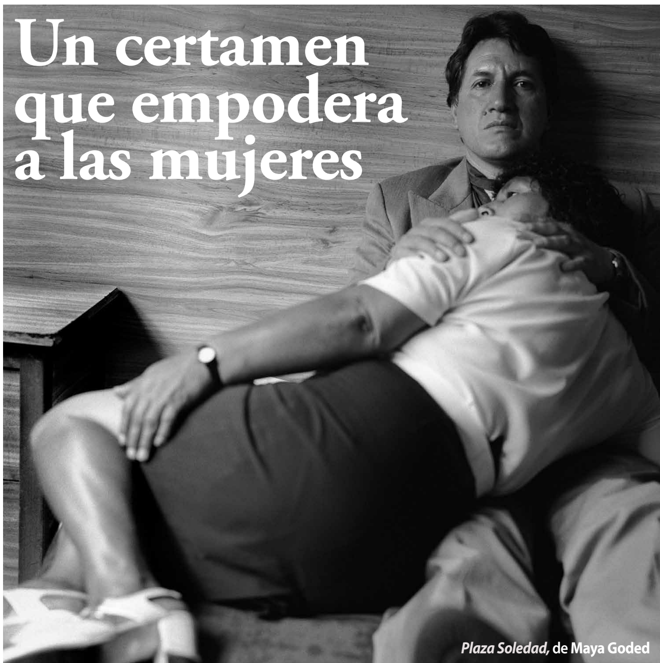
Plaza Soledad, de Maya Goded